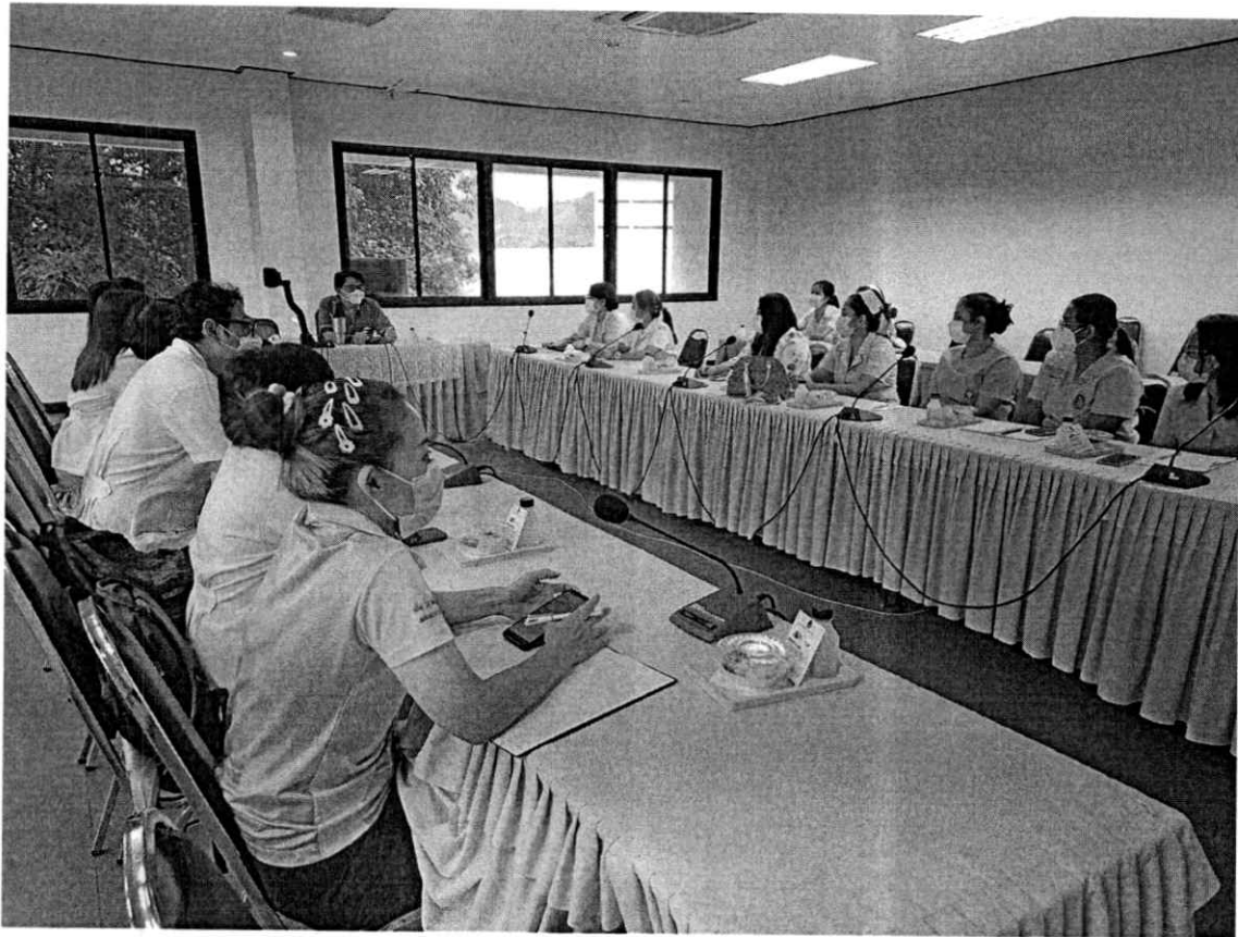
ภาพการประชุม ครั้งที่ ๑