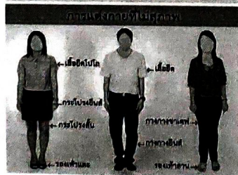
ให้เกียรติสถานที่ ให้เกียรติตัวเอง