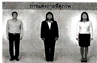
การแต่งกายที่สุภาพ สำหรับการสมัครสอบ

สุภาพบุรุษ สวมเสื้อเชิ้ตมีปก กางเกงขายาว (ห้ามสวมกางเกงยีนส์) โดยสอดชายเสื้อไว้ในกางเกง สวมรองเท้าหุ้มส้นหรือรองเท้ายัด ประพฤติตนเป็นสุภาพชน และไม่รับสมัครผู้ที่แต่งกายไม่สุภาพ