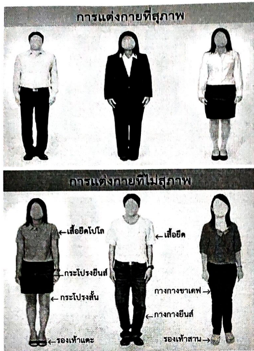
การแต่งกายที่สุภาพ สำหรับการสมัครสอบ